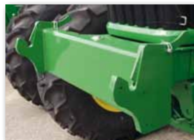
Interface pour masses monoblocs et évolutives jusqu'à 1400 kg